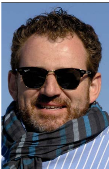
Cédric Thévenot © Gras Savoye – Tous droits réservés

Cette gamme de produits d'assurances nous permet de proposer à nos clients et prospects des conditions de grande qualité à des tarifs compétitifs ainsi que d'optimiser les modes de fonctionnement avec nos partenaires assureurs pour permettre aux équipes dédiées à ces gammes de produits, réactivité et disponibilité.