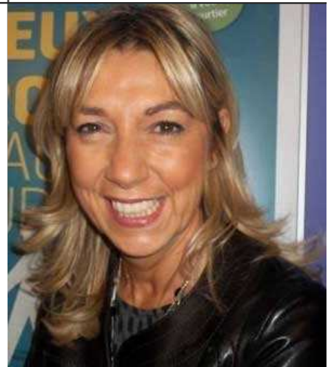
Colette Bruzzi

Un suivi et un accompagnement personnalisé jusqu'à l'application de la décision de justice ou de la transaction et la mesure de la satisfaction par une enquête qualité après clôture.