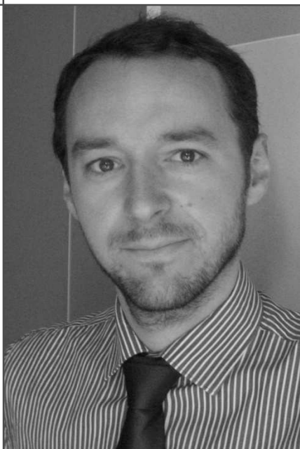
François Lanavère © Gras Savoye – Tous droits réservés

2 – les cartes « Infinite » ou « Platinum » : Visa Infinite, Amex Platinum et Mastercard Platinum